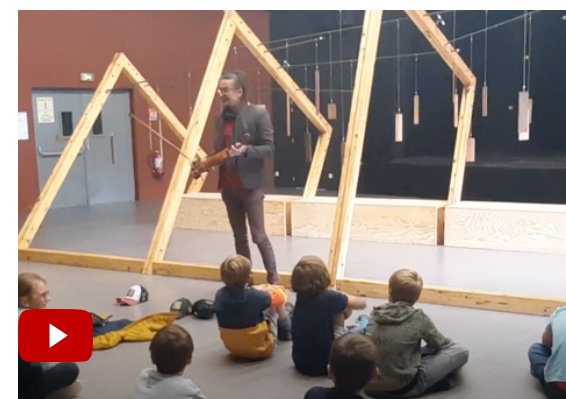
Vidéo privée de l'expérimentation