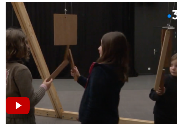
Interview sur l'expérimentation | France 3